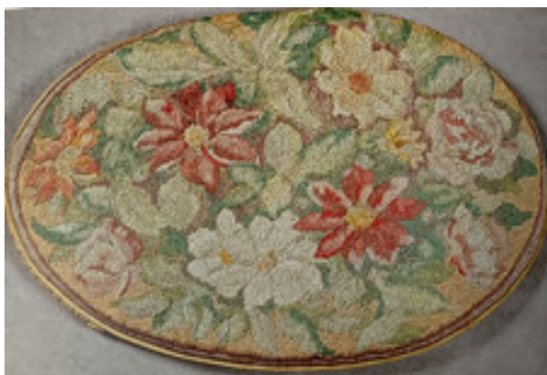
Coussin aux anémones