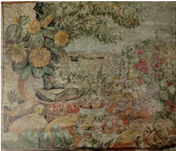
Tapiserie sans le personnage central

Avec l'étroite collaboration de sa femme, Paul Deltombe organise un atelier de confection de tapisserie à l'aiguille qui permet à la fois de procurer des ressources aux femmes des soldats mobilisés, et de donner libre cours à son goût très vif pour les arts décoratifs.