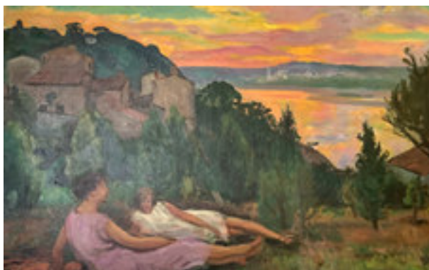
Soleil couchant sur la Loire (Yvonne et Sylviane)

En dehors de cette question technique réglée par Yvonne Deltombe, les deux époux se sont mis d'accord sur une question essentielle et bien dans l'air du temps : celle de la nécessaire limitation des coloris à utiliser.