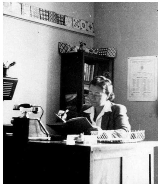
Dans son cabinet de travail